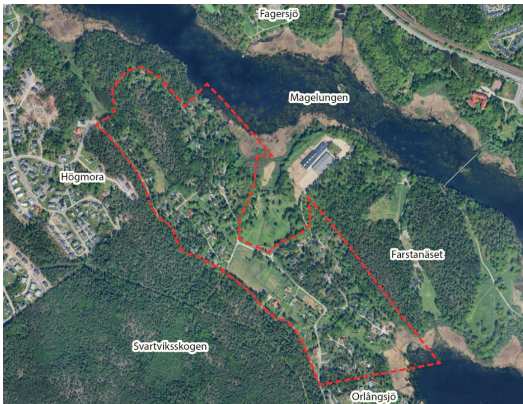
Flygfoto med planområdet markerat med streckad röd linje.

Detaljplanen syftar till att omvandla ett befintligt småhus- och fritidshusområde till permanentbostäder samt möjliggör för ny bebyggelse i form av nya bostäder och en grundskola.